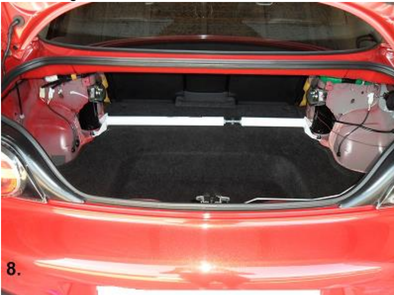
Bild 8 zeigt die verbaute Domstrebe